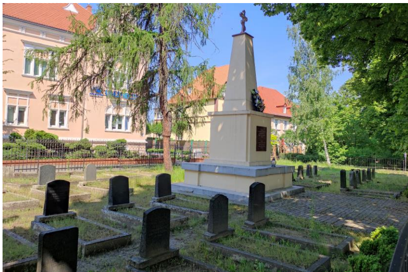
Widok cmentarza od południowego – wschodu.

7. Fotografia z opisem wskazującym orientację w stosunku do sąsiednich terenów lub stron świata albo mapa z zaznaczonym stanowiskiem archeologicznym