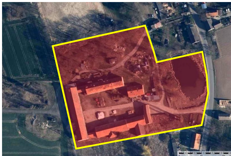
Zdjęcie satelitarne obrazujące zasięg obiektu.