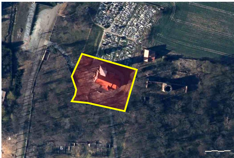
Zdjęcie satelitarne obrazujące zasięg obiektu.

Rejestr zabytków nr A/1664/637 z dnia 7.12.1959 r. (kościół)