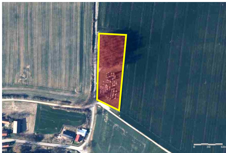
Zdjęcie satelitarne obrazujące zasięg obiektu.

Miejscowy plan zagospodarowania przestrzennego: Uchwała nr XXX/197/2016 Rady Miejskiej Ząbkowic Śląskich z dnia 8 lipca 2016 r.