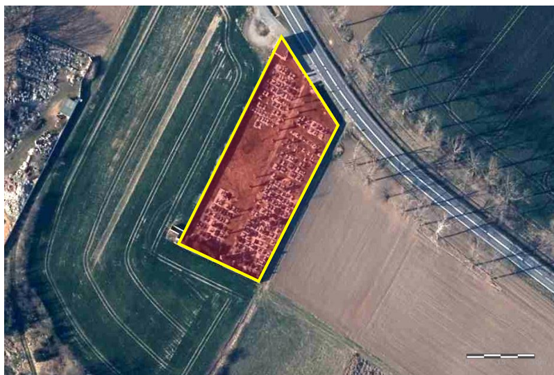
Zdjęcie satelitarne obrazujące zasięg obiektu.

Miejscowy plan zagospodarowania przestrzennego: Uchwała nr XXVI/180/2016 Rady Miejskiej Ząbkowic Śląskich z dnia 28 kwietnia 2016 r.