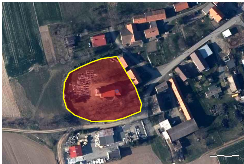
Zdjęcie satelitarne obrazujące zasięg obiektu.