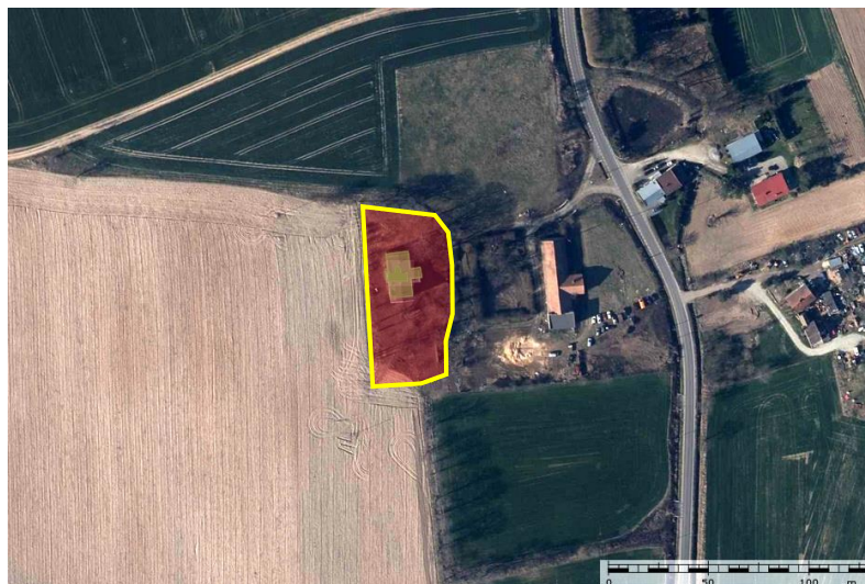
Zdjęcie satelitarne obrazujące zasięg obiektu.

Rejestr zabytków nr A/3595/1476/Wł z dnia 31.01.1996 r.