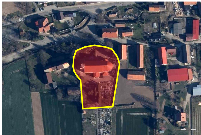
Zdjęcie satelitarne obrazujące zasięg obiektu.