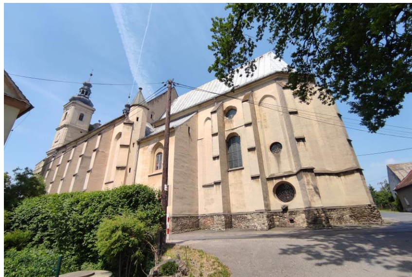
Widok od południowego – wschodu.